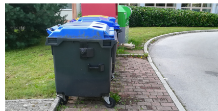
Ureditev nadstrešnice pri OŠ Tabor

Besedilo in foto: Matjaž Kurent, vodja projekta, Komunalno podjetje Logatec