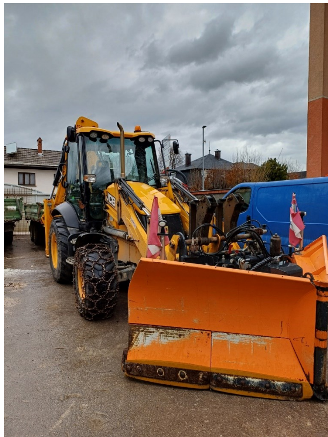
Priprave na zimsko službo